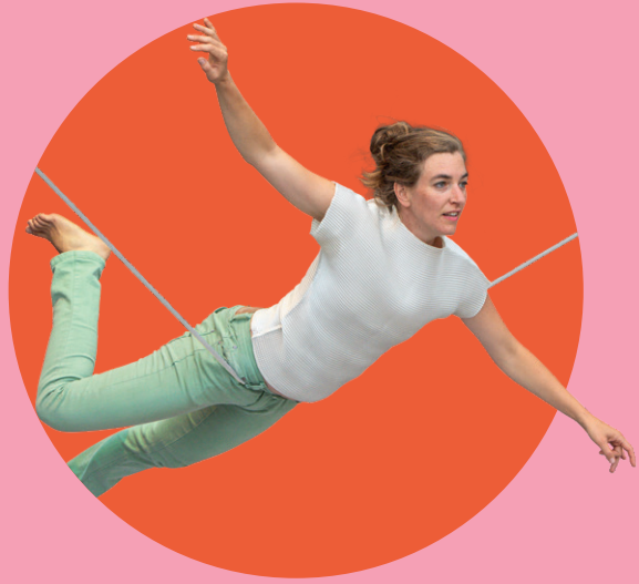
FEMALE CIRCUS, Foto: Judith Stehlik