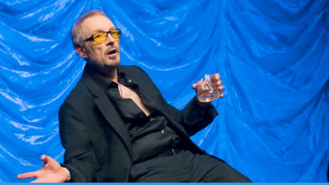
Josef Hader

Der larmoyante Abgesang eines sogenannten alten weißen Mannes auf sich selbst hallt einsam von der Bühne. Doch sein Ausklang wird gestört. Durch eine jüngere Protagonistin, die selbst auch nicht vor zynischer Melancholie gefeit ist: sich einfach mal entspannen! Im Patriarchat.