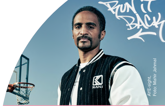
AYE-sight