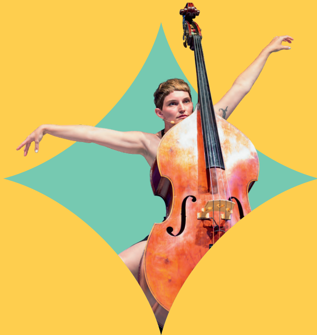
Bass Ball(ett)