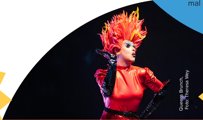
Queens Brunch, Foto: Theresa Wey

Queens Brunch ist zurück mit einer erstklassigen Varieté-Show ... und zwar am Fußballplatz! Gemeinsam lassen wir Vielfalt und Gegensätze hochleben. Auf der Bühne warten internationale Drag- und Queer-Künstler:innen mit Tanz, Live-Musik, Comedy, Burlesque und ordentlich Drama!