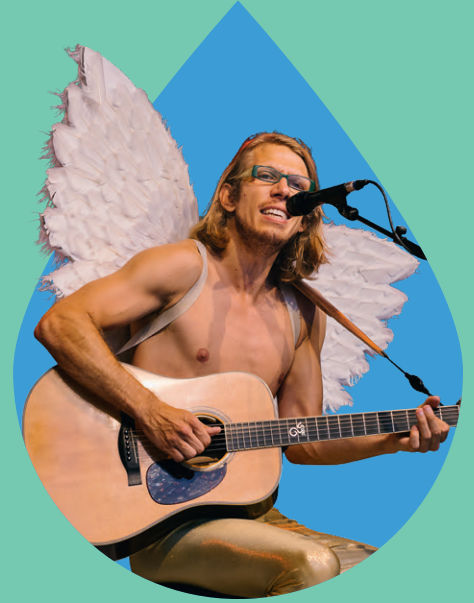
Blonder Engel