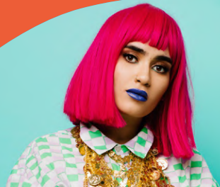
IZRAA, Foto: Ina Aydogan

Meischlgasse ASK Erlaa, 28. Juli, 18:30 Uhr